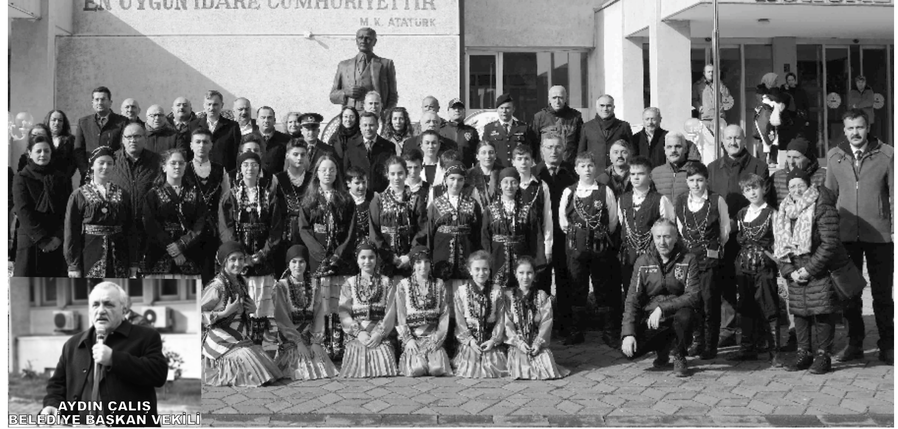
AYDIN ÇALIŞ BELEDİYE BAŞKAN VEKİLİ