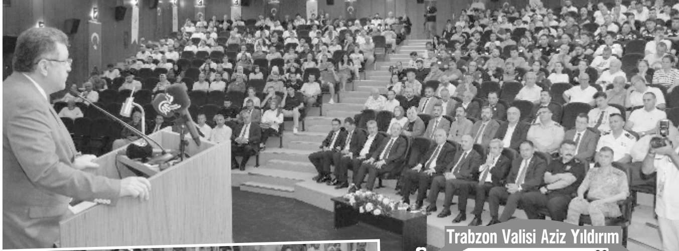
Trabzon Valisi Aziz Yıldırım