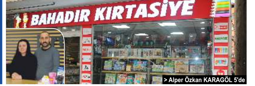
> Alper Özkan KARAGÖL 5'de

Vakfikebir ilçemizin sevilen ve sayılan esnaflarından Ahmet Bahadır, Kemalîye Mahallesi 14 Şubat Kurtuluş Caddesi üzerinde ikinci işyerini müşterilerinin hizmetine açtı.