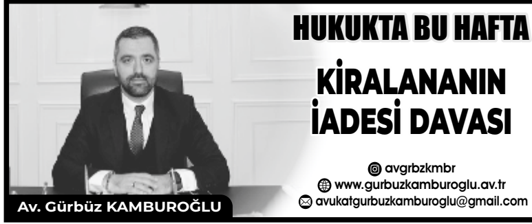
Av. Gürbüz KAMBUROĞLU

bulunur. Kiracının kiralananı sözleşmeye uygun olarak özenle kullanma ve komşulara saygı gösterme borcu çeşitli