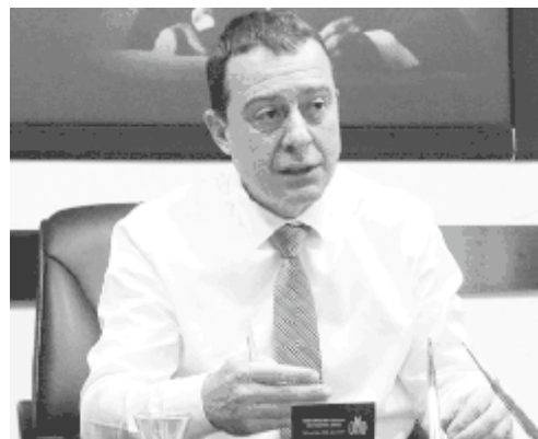
SAYILARIMIZ CİDDİ BOYUTLARA ULAŞMAYA BAŞLADI