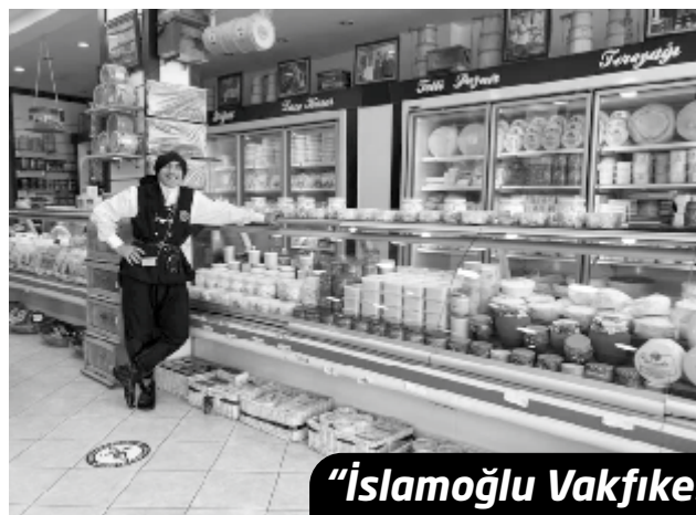
"İslamoğlu Vakfikebir Yöresel Lezzetler"

Vakfikebir ilçesinin marka değerlerinden biri olan İslamoğlu Gıda, bir süre önce TRENDYOL'da Vakfikebir'den dünyaya açılan lezzetli ürünlerin satışlarına başlamıştı. 7/24 saat hizmet veren ülkenin en büyük alış-veriş mağazalarından bir olan