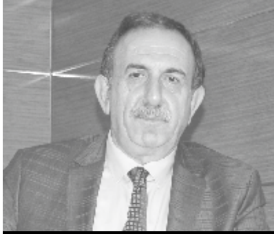
Kadri Alay Okul Müdürü

Koronavirüs sebebiyle 2020-2021 eğitim öğretim yılı 9. 10 ve 11. sınıflar için Uzaktan Eğitim sistemi ile devam ediyor. Vakfikebir Gülbahar Hatun Anadolu Lisesi 9.Sınıf öğrencilerine yönelik oryantasyon eğitimi başlattı.