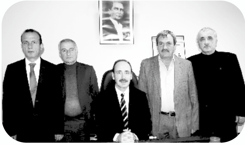
VAKFIKEBİR ESNAF SANATKÂRLAR KREDİ VE KEFALET KOOPERATİFİ

2023 Yılını ailenizle, akrabalarınızla, komşularınızla huzur içerisinde geçirmenizi temenni ediyorum.