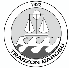
AVUKAT Gürbüz KAMBUROĞLU

Yeni Yılınızı en iyi dileklerimle kutlar, sağlık ve mutluluklar dilerim.