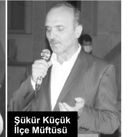
Şükür Küçük İlçe Müftüsü

olmak, ayrışmadan bir ve bütün kalabilmektir. 15 Temmuz Milli Birlik ve Beraberlik Günüümüz 'de hain darbe girişiminin seyrini değiştiren Ömer