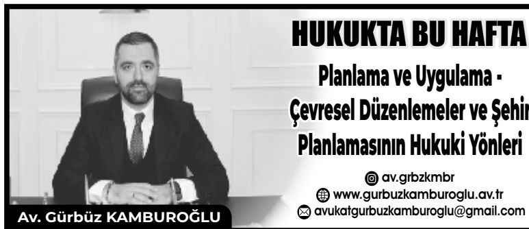
Av. Gürbüz KAMBUROĞLU

uyulması gibi konuları düzenleyen bir yasadır. Şehir planlamasının yasal çerçevesi ayrıca "Çevre Kanunu" gibi diğer mevzuatlarla da desteklenir. Çevre Kanunu,