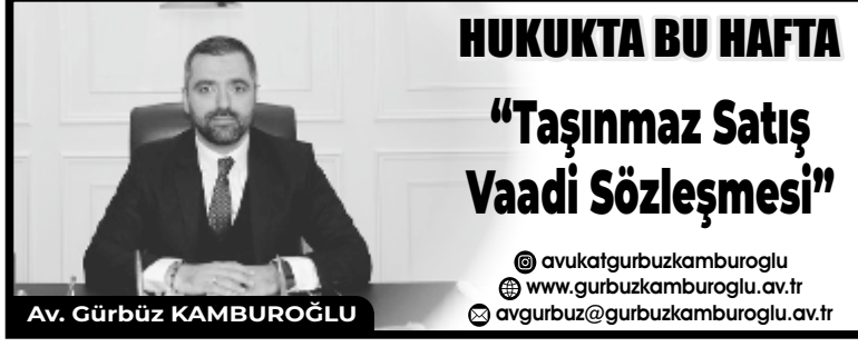
Av. Gürbüz KAMBUROĞLU

olduğundan sözleşmede belirlenen tarih geldiğinde tapunun devredilmesi gerekir. Tapunun devredilmemesi halinde uygulamada hükmen tescil olarak adlandırılan tapu iptal ve tescil davası açılabilir. Taşınmaz Satış Vaadi Sözleşmelerinde Zamanaşımı Taşınmaz satış vaadi sözleşmesinin tabi olduğu özel bir zamanaşımı rejimi söz konusu değildir. Bu nedenle zamanaşımı konusunda Türk Borçlar Kanunu madde 146 hükümleri gereği 10 yıllık zaman aşımı süresi uygulanır. Yargıtay'ın istikrar kazanmış kararlarına göre zamanaşımı süresi, ifa olanağı doğduğu andan itibaren başlayacaktır. Ayrıca taraflarca bu sözleşmeye eklenecek 'zamanaşımından feragat ediyorum' şeklindeki şerh, Türk Borçlar Kanunu m.160/1 gereği sözleşmelerden doğan alacak haklarından ve diğer fer'i alacaklardan önceden feragat edilemeyeceği belirtilmediğinden geçersiz olacaktır.