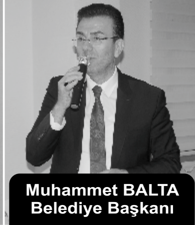
Muhammet BALTA Belediye Başkanı