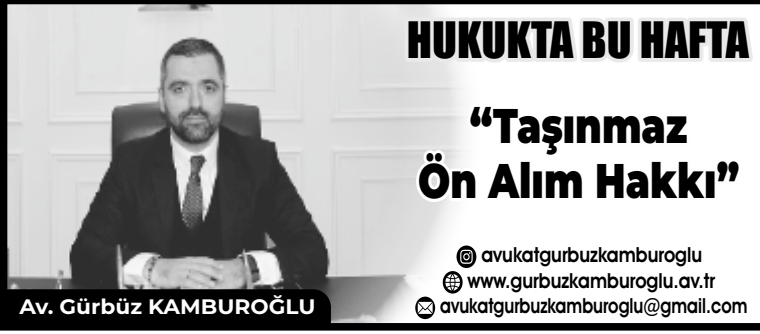
Av. Gürbüz KAMBUROĞLU

ilişkin hukuki işlemin tarafı olan davalı 3. kişi durumunda davacıya karşı bedelde muvazaa iddiasında bulunamaz ise de davacı önalım hakkına engel olmak amacıyla satış bedelinin resmi satış senedinde yüksek gösterildiğini iddia edebilir ve bu iddiasını tanık dahil her türlü delille kanıtlayabilir. (Yargıtay 14. Hukuk Dairesi 2020/311E. 2020/8547K.) Ancak şunu da ifade etmek gerekir gerçek satış bedelinin belirlenmesi amacıyla keşif incelemesi yapılarak bilirkişi raporu alınmış olsa da Keşifte bilirkişinin belirlediği değer tek başına bedelde muvazaayı ispatlamaya yeterli değildir. Önalım hakkının kullanılmasının önlenmesi için paydaşların önalım hakkından feragat hususu da TMK m.733'te açıklanmıştır.