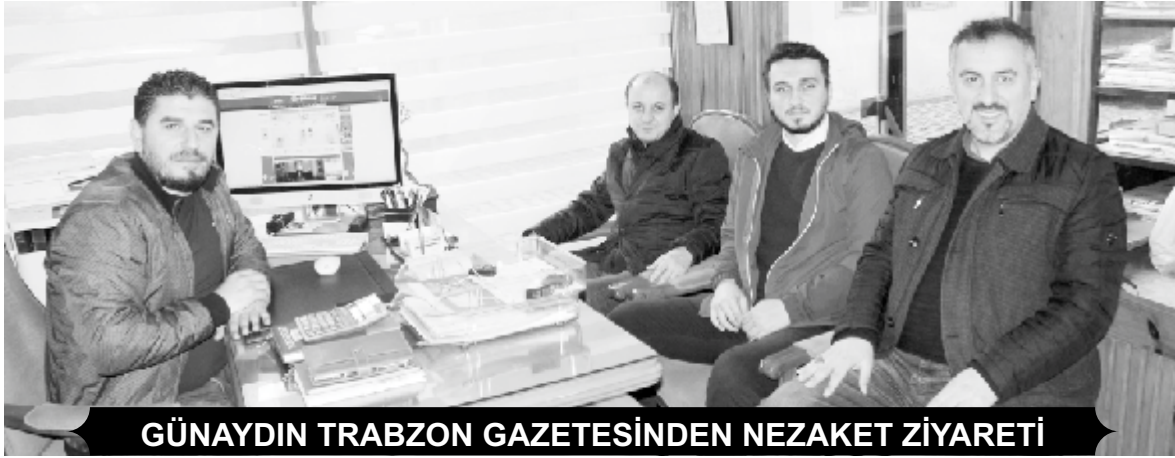
GÜNAYDIN TRABZON GAZETESİNDEN NEZAKET ZİYARETİ

kameramanına, foto muhabirinden editörüne kadar tüm alanlardaki medya çalışanlarından Covid-19'a yenik düşenler, en yakınlarını bu hastalığa kurban verenler de oldu. Tüm zorluklara rağmen biz gazeteciler olarak hiçbir zaman vazgeçmedik. İsviçre'nin Cenevre kenti merkezli sivil toplum kuruluşu Press Emblem Campaign'in (PEC) 5 Ocak'ta yaptığı açıklamaya göre, mart başından bu yana 59 ülkeden 600'den fazla gazeteci Covid-19 nedeniyle yaşamını yitirdi. Salgın nedeniyle Türkiye'de de 17 gazeteci vefat etti. Ölen