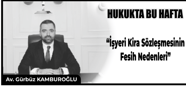
Av. Gürbüz KAMBUROĞLU

teslim etmek ve kira süresince de kullanıma elverişli durumda bulundurmamak zorundadır. Önemli aybın kıstası, TBK'nın bakımından çekilmez kiracı açısından elverişliliğinin ortadan kalkması veya önemli ölçüde engellenmesidir.