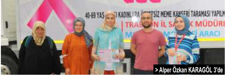
> Alper Özkan KARAGÖL 3'de

Sağlık Bakanlığı tarafından Mobil Kanser Tarama Aracı Vakfikebir ilçemizde hizmete başladı. Mobil Kanser Tarama Aracı 15-26 Ağustos tarihleri arasında Vakfikebir Kemalîye Mahallesi'nde Büyükkliman Aile Sağlığı Merkezi önünde ücretsiz olarak 40-69 yaş grubu bayanlara kanser taramaları yapacak.