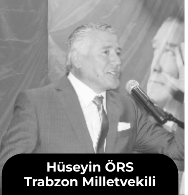
Hüseyin ÖRS Trabzon Milletvekili