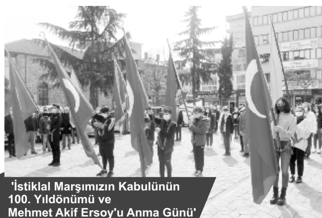
'İstiklal Marşımızın Kabulünün 100. Yıldönümü ve Mehmet Akif Ersoy'u Anma Günü'