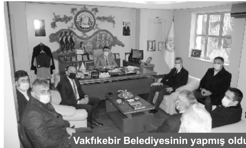
Vakfikebir Belediyesinin yapmış olduğu hizmetleri gerçekten takdir ediyoruz

Rabbimiz mahcup etmesin diyerek sözlerini tamaladı. 7 YILDIR BURADA YAPMIŞ OLDUĞUNUZ ÇALIŞMALAR GERÇEKTEN GÖZ DOLDURUYOR Vakfikebir Belediyesinin yapmış olduğu hizmetleri gerçekten takdir ediyoruz. Sizin 7 yıldır burada yapmış olduğunuz çalışmalar gerçekten göz dolduruyor. Bu çalışmalar sayesinde ilçe halkının gözünde bir karışığı var. İlçedeki oy oranımızın artması dediğiniz gibi onun karşılığını