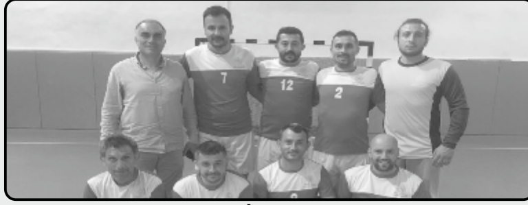
GENÇLİK VE SPOR