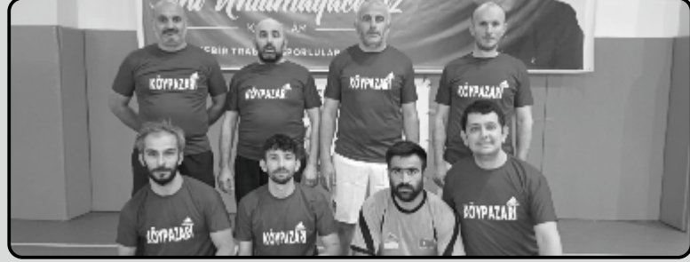
KIRAZLIK KÖY PAZARI