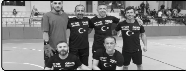
ÇARŞI MUHTAR GÜCÜ

Vakfıkebir Kapalı Spor Salonunda birbirinden zevkli ve çekişmeli maçlara sahne olan turnuva, hafta içi her gün 3 maçla saat 19'dan itibaren heyecanlı bir şekilde devam ediyor.