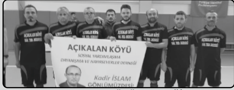
AÇIKALAN KÖYÜ DERNEĞİ