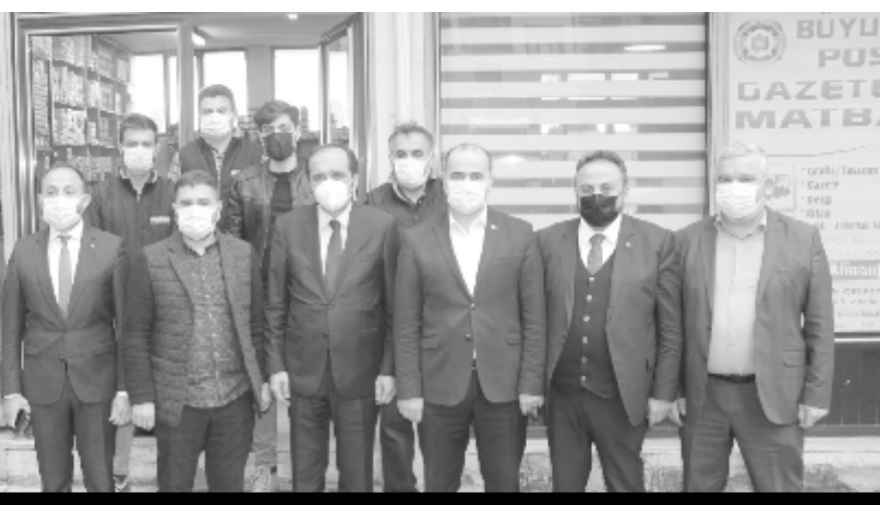
TBBM Çevre Komisyon Başkanı ve AK Parti Trabzon Milletvekili Muhammet Balta ve beraberindeki heyet Büyükliman Postası Gazetemizi ziyaret etti.

Bakanımız Sayın Murat Kurum'a ilçem adına ve ayrıca Trabzon'un her noktasına verdikleri destek için çok teşekkür ediyorum. 14 Şubat Caddesi vitrin ve vizyon bir proje, bunlar yapılıyor. Özellikle Büyükşehir'imizin ilçemizde planladığı projeler var. Kapalı Pazar Yeri, Otopark, Tonya Caddesinin sokak düzenlemesi. Bunların arka tarafında projeleri bitmek üzere. Yine Büyükşehir'imiz bu bölgede cenazelerin rahatlıkla yıkabilmesiyle alakalı bir