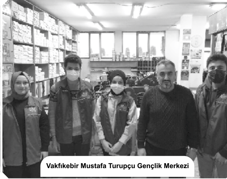
Vakfikebir Mustafa Turupçu Gençlik Merkezi