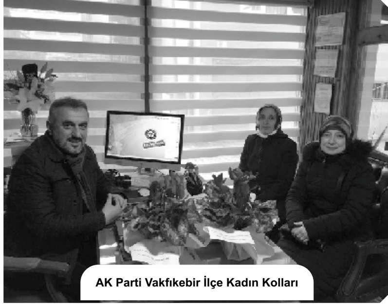
AK Parti Vakfikebir İlçe Kadın Kolları