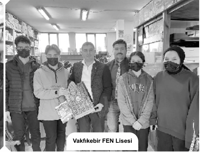
Vakfikebir FEN Lisesi