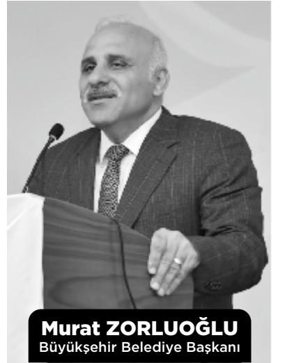
Murat ZORLUOĞLU Büyükşehir Belediye Başkanı

Trabzon Valisi İsmail Ustaoglu ise dini ihtisas merkezlerinin millete hizmet noktasında önemli görevler üstlendiğini ifade ederek "Burada 8 ay boyunca eğitim göreceğiz olan din