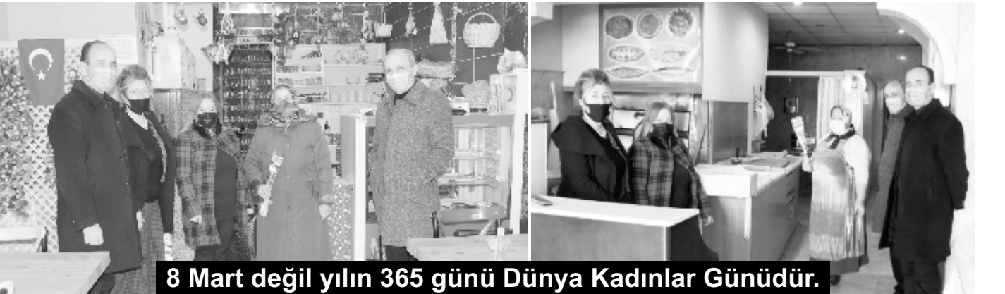
8 Mart değil yılın 365 günü Dünya Kadınlar Günüdür.

mutluluğunu yaşıyoruz. Dünya tarihine emeği geçmiş, bugüne gelmemize önderlik etmiş bütün kadınlarımızı saygıyla, şükranla anıyoruz. Yükselmenin sınırı yoktur. Bizler, 100. yılını yaşayacak Cumhuriyetimiz de ülkemizi, dünyanın en güçlü 10 ekonomisi arasında saygın, başı dik, alni ak, vicdani hür bir toplumla dünya ülkeleri arasına taşıma gayretini göstermek zorundayız. Mustafa Kemal'in bu ülküsünü gerçekleştirecek kadınlarımızın yapacağı fedakârlıkları, çalışmalarını, şimdiden tebrik ediyorum. Bundan sonra yapacağımız bütün çalışmalarda, kadının emeği, değeri ve hizmeti olacaktır. Bu vesile ile 8 Mart Dünya Kadınlar Günü'nü kutluyor, Türk ve dünya kadınlarına sağlık ve mutluluk dolu bir gelecek diliyorum" dedi. Vakfikebir ilçe genelinde Esnaf Odasına kayıtlı kadın esnaf ve sanatkar bayanlar işyerlerinde ziyaret edilerek çiçek takdim edilerek başarı dileklerinde bulundular.