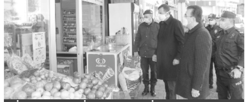
İLÇE GENELİDEN DENETİMLER YAPILDI

de vaka sayısının sona ermesi, sıfırlanması. Bizler denetim çalışmalarına bütün gücümüz ve kuvvetimizle devam edeceğiz. Yalnız bizim tek başımıza bu çalışmayı yürütmemiz yeterli olmaz. Dolayısıyla Vakfikebir’inde bizim yanı sıra yer alması ve aynı bilinç içerisinde alması gereken maske, mesafe ve hijyen kurallarına sıkı sıkıya riayet etmesi, işletmelerimizin masa, mesafe ve HES kodu uygulamasını kontrol etmesi başarımızı yada başarısızlığımızın temelini oluşturacak. Bu çalışmalarda başarılı olmamız el birliği ile aynı bilinç içerisinde hareket etmemiz olacaktır” dedi. “İYİ NOKTADAYIZ” Vakfikebir en iyisi olmak