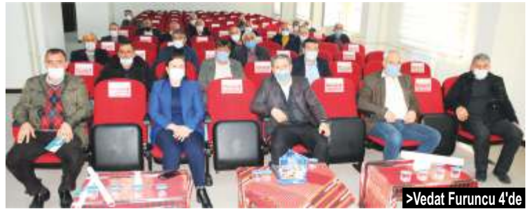
> Vedat Furuncu 4'de

Trabzon İl Afet ve Acil Durum (AFAD) Müdürlüğü tarafından Vakfıkebir Kaymakamlığı gözetiminde ilçedeki mahalle muhtarlarına online "Afet Farkındalık Eğitimi" verildi.