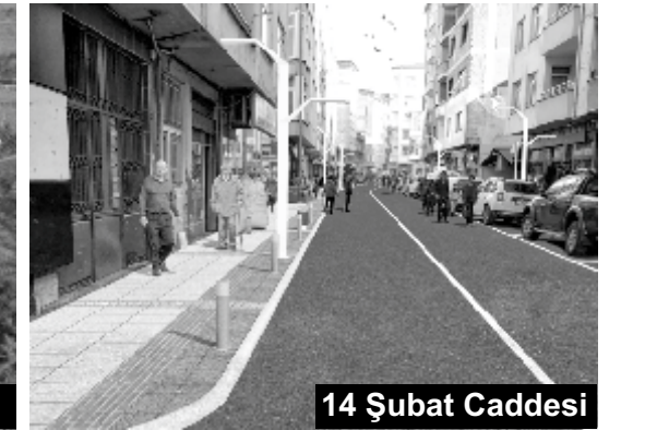
14 Şubat Caddesi