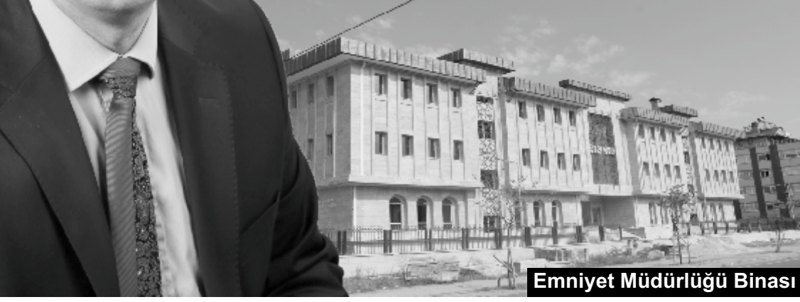
Emniyet Müdürlüğü Binası

Vakıfkebir için büyük bir gayretle çalışıyoruz.