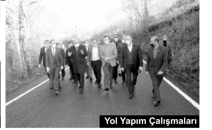
Yol Yapım Çalışmaları