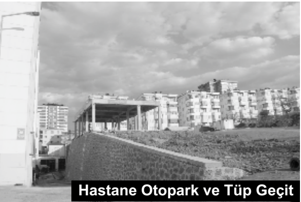
Hastane Otopark ve Tüp Geçit

"HASTANEYE OTOPARK VE TÜP GEÇİT" Vakıfkebir Devlet Hastanemizin arka tarafında bulunan arsada otopark ve otoparktan hastaneye geçişi sağlayacak tüp geçit inşaatının çalışmaları devam ediyor. "PAZARYERİ PROJESİ"