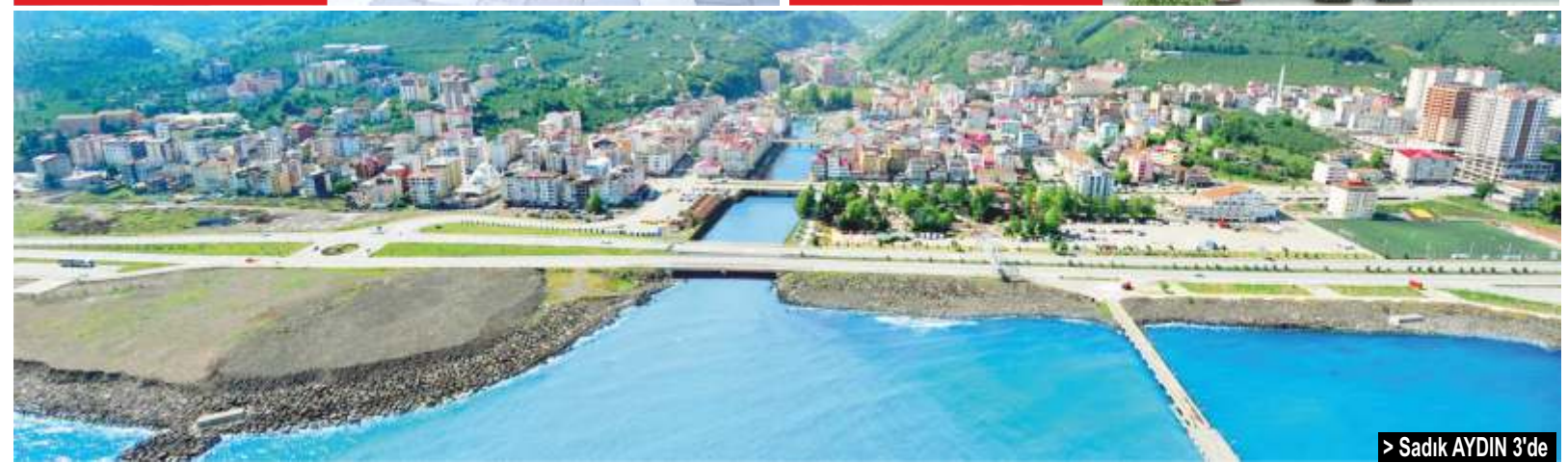
> Sadık AYDIN 3'de