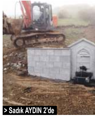
> Sadık AYDIN 2'de