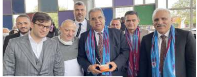
Kıbrıs düzenlenen hamsi festivalinde KKTC Başbakanı Faiz Sucuoğlu, Kebir marka ürünlerinden yapılmış olan kuymağı görünce şaşı kaldı. > Ahmet KAMBUROĞLU 3'de