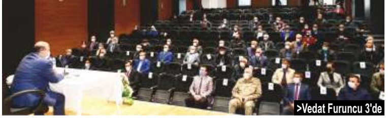
> Vedat Furuncu 3'de

Trabzon Valisi İsmail Ustaoğlu, Vakfıkebir ilçemize bağlı mahalle muhtarlarıyla bir araya gelerek Covid-19 salgını sürecinde uygulanacak tedbirlerle ilgili değerlendirmelerde bulundu.