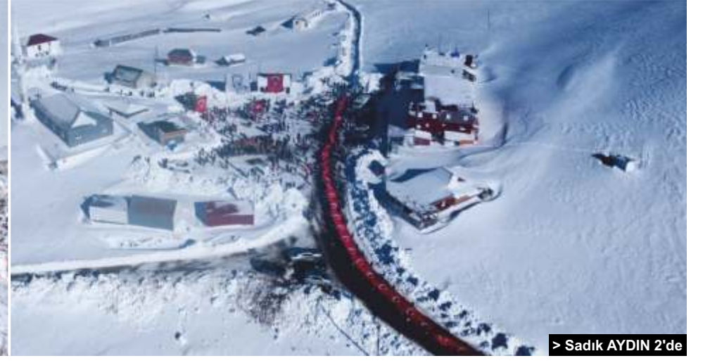
> Sadık AYDIN 2'de