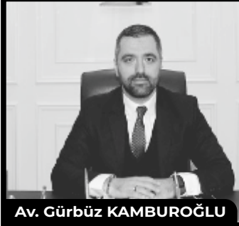
Av. Gürbüz KAMBUROĞLU

2- İşlenen Suç Küçük Düşürücü Nitelikte Olmalıdır. Kanunda küçük düşürücü suçlar şeklinde bir sınıflandırma bulunmamaktadır. Bir suçun