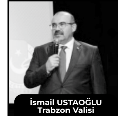
İsmail USTAOGLU Trabzon Valisi