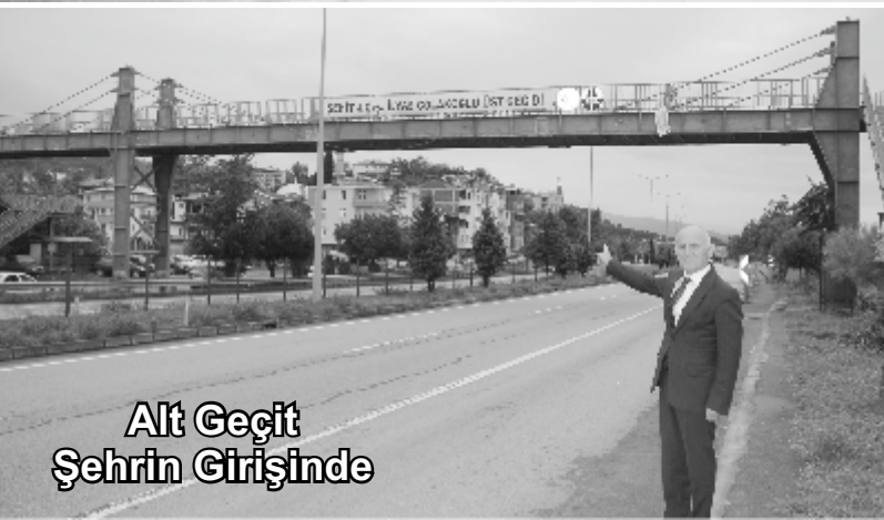
Alt Geçit Şehrin Girişinde

çözüm gerekiyor. Yalıköy esnafımız eskiden yaya geçişi olarak konulan daha sonra kapatılan yere, Akçaabat İlçemizdeki Sahil yolunun muhtelif yerlerinde olduğu gibi "Butonlu Trafik İşığı"nın konulması durumunda bu sorunun çözüleceğini ifade ediyor. Bu konuda bütün yetkililerden gereken hassasiyeti göstermelerini, Yalıköy halkımızın bu mağduriyetine son vermelerini istiyoruz.