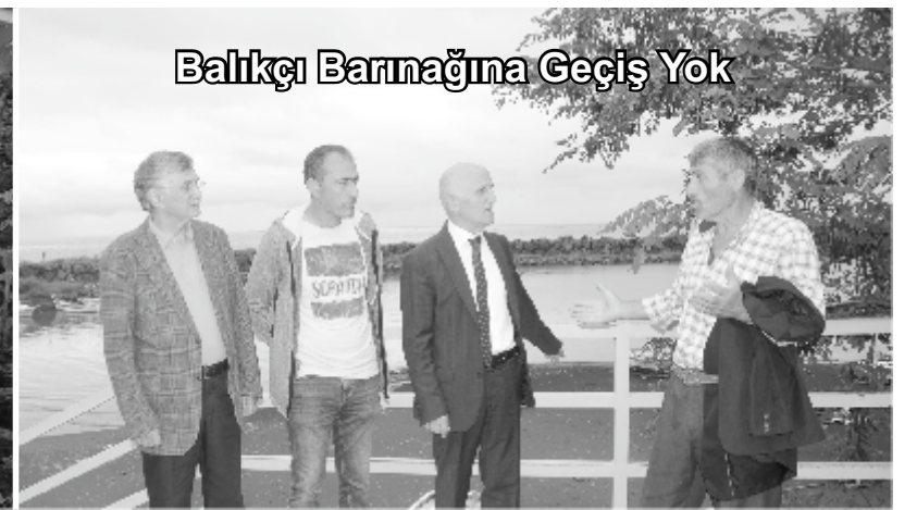
Balıkçı Barınağına Geçiş Yok