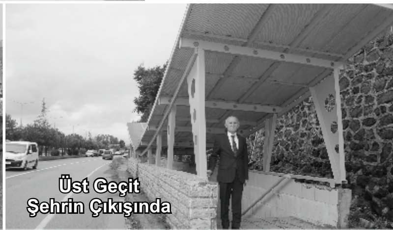
Üst Geçit Şehrin Çıkışında