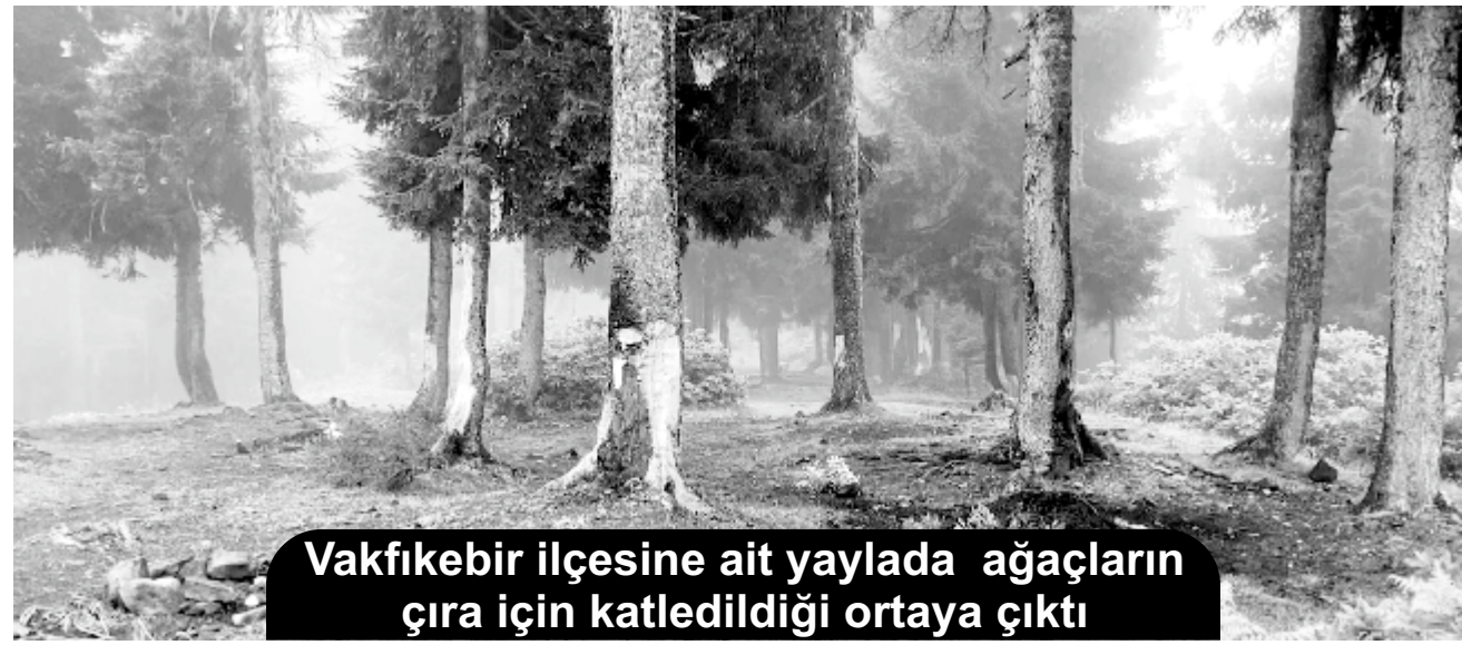
Vakfıkebir ilçesine ait yaylada ağaçların çıra için katledildiği ortaya çıktı

Ormanlardaki çam ağaçlarının gövdesinden çıra almak uğruna, asırlık çam ağaçları katlediliyor. Karadağ Yaylası ormanlık alan içerisinde çok sayıda çam ağacı tahrip edildi. Kimliği belirsiz kişi veya kişiler çıra elde edebilmek için ağaç gövdelerini kesici aletler ile oyarken, çok sayıda ağacı da tamamen keserek katlettiler. Durumu gören duyarlı bir vatandaş cep telefonuyla çektiği görüntüleri sosyal medya hesabından paylaştı. Sosyal medya da paylaşılan