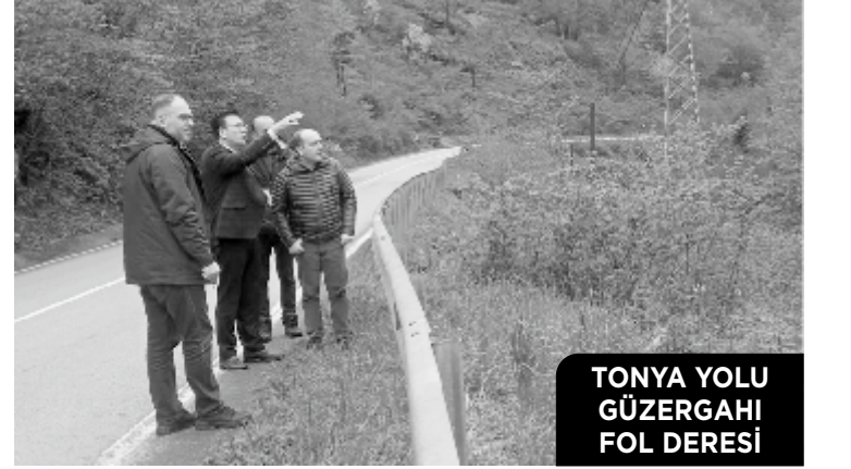
TONYA YOLU GÜZERGAHI FOL DERESİ

gayretlerimizin karşılığını da alıyoruz. DSİ tarafından ilçe merkezimizden geçen Fol Deresi ve 9 yan dere üzerinde yapılacak yeni yatırımların yer teslimi yapıldı, çalışmalar başlıyor. Sözleşme bedeli 33 milyon 853 bin TL olan yeni iş kapsamında 5 adet tersip bendi, 1813 metre betonarme U kanal, 1453 metre beton ağırlık duvar, 601 metre kargir duvar, 527 adet kaskat, 6 adet menfez ve 2 adet yaya köprüsü