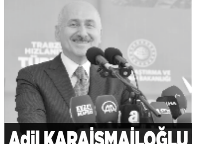
Adil KARAIŞMAİLOĞLU Ulaştırma ve Altyapı Bakanı Trabzon Milletvekili Adayı

Ulaştırma ve Altyapı Bakanı Adil Karaismailoğlu ise muhteşem bir eserin açılışını gerçekleştirdiklerini belirterek şu ifadeleri kullandı; "Hemen yukarıdaki Arafilboyu'nda büyüdük. Buradan aldığımız kokuyu enerjile büyüdük. O yüzden bize her yer Trabzon diyoruz. Çok büyük planlarımız var. Türkiye tarih yazıyor. Hayalleri gerçeğe dönüştürüyoruz. Hayalleri gerçeğe dönüştürmeye devam edeceğiz. Bakınız Zigana Tüneli 1080 rakımlara indirmiştik. Bugüne geldiğimizde 14 bin metrelik bir tünelden bahsediyoruz. Eser ve hizmet firtinası estiriyoruz. Son 10 gündür yaptığımız izliyorsunuz. Trabzon için çok büyük hedeflerimiz var. Kanuni Bulvarı bitiyor. Trabzon'a nefes aldiracak Güney Çevre Yolu'nun temelini attık. Trabzon bunları hak ediyor. AK Partili bir Belediye olduğu için keyifli açılışlara katılıyoruz. İstanbul Ankara'da ne oldu? Hastanenin yapılmakta olan yolunu Belediye durdurulabilir mi? Yapılan yatırımın üzerine hafriyat döken bir Belediyeden bahsediyoruz. Ya yapılan hizmetler takdir edilecek ya da ülkeyi karıştırmak isteyenlere yetki verilecek. Vatandaşın derdiyle dertlenmeyen bir belediye olabilir mi? İstanbul'da Ankara'da Adana'da bütçeler var ama ortada hizmet yok.