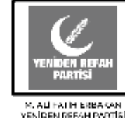
M. FATİH ERBAKAN YENİDEN REFAH PARTİSİ