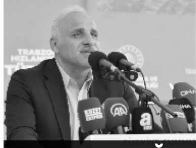
Murat ZORLUOĞLU Trabzon Büyükşehir Belediye Başkanı

Trabzon Büyükşehir Belediye Başkanı Murat Zorluoğlu'nun vizyon projeleri arasında yer alan ve şehrin marka değerini yükselten Ganita-Faruz Sahil Düzenleme Projesi, görkemli bir törenle hizmete açıldı.