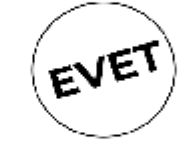
DEVLET BAHÇELİ MİLLİYETÇİ HALKÇI PARTİ