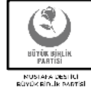
BÜYÜK BÖLÜN PARTİSİ