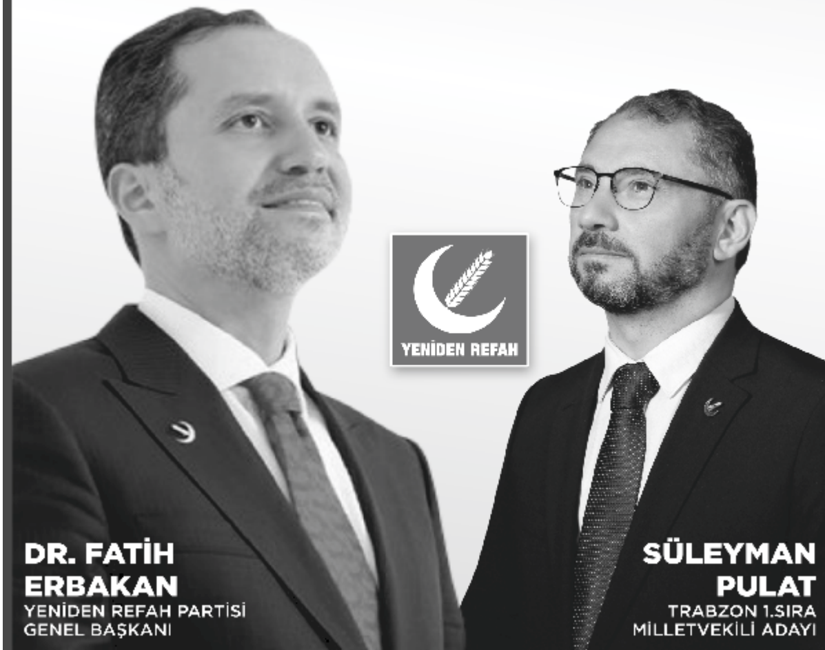
DR. FATİH ERBAKAN YENİDEN REFAH PARTİSİ GENEL BAŞKANI