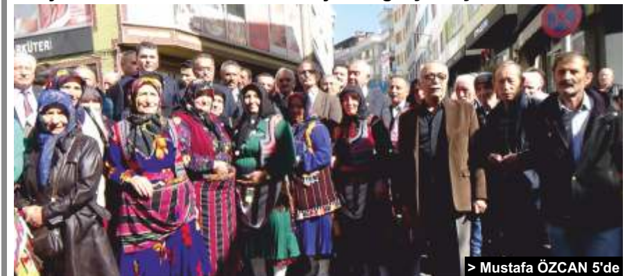
> Mustafa ÖZCAN 5'de

Demokrat Parti Genel Başkanı Gültekin Uysal Şalpazarı ilçesinde aday tanıtımına katılarak esnaf ziyareti gerçekleştirdi.