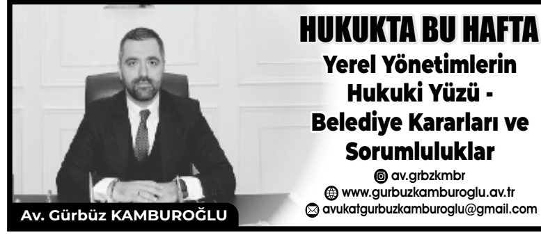
Av. Gürbüz KAMBUROĞLU

olmalıdır. Yetki ve Sorumluluk Belediyelerin yetkileri, vatandaşların yaşam kalitesini artırmaya yönelik hizmetler sunmayı içerir. Bu hizmetler arasında altyapı, ulaşım,