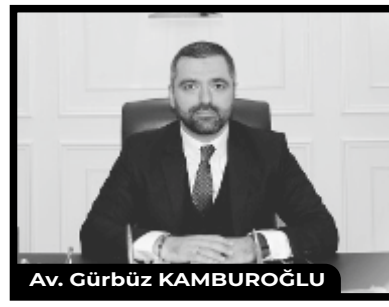
Av. Gürbüz KAMBUROĞLU

yer alması senedi geçersiz kılar ve kambiyo vasfını ortadan kaldırır. Bu kapsamda senedin geçerliliği için ödeme vaadinin hiçbir kayda ya da şarta bağlanmaması zorunlu unsurdur. Ödenecek tutar senedin üstünde belirtilir. Tutarın senedin üstünde yazıldığı yer önemli değildir. Ödeme vaadi belirli bir miktar para borcuna