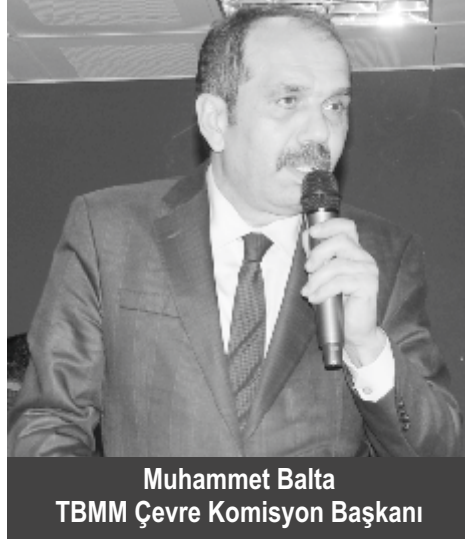
Muhammet Balta TBMM Çevre Komisyonu Başkanı