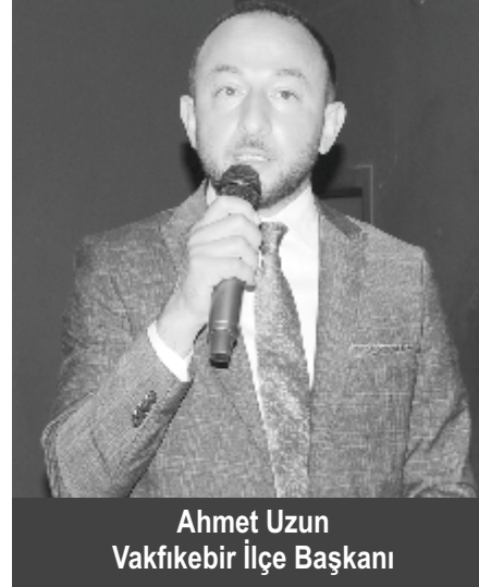
Ahmet Uzun Vakfikebir İlçe Başkanı