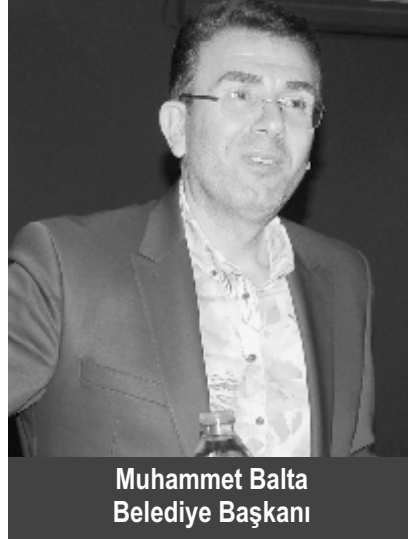
Muhammet Balta Belediye Başkanı