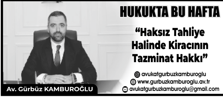
Av. Gürbüz KAMBUROĞLU

Mahkemeye tahliye karar verildiği halde taşınmaz kiracı tarafından kendiliğinden boşaltılmış ise bu madde hüküm uygulanmaz. Bu maddenin uygulanabilmesi için mahkemeye verilen