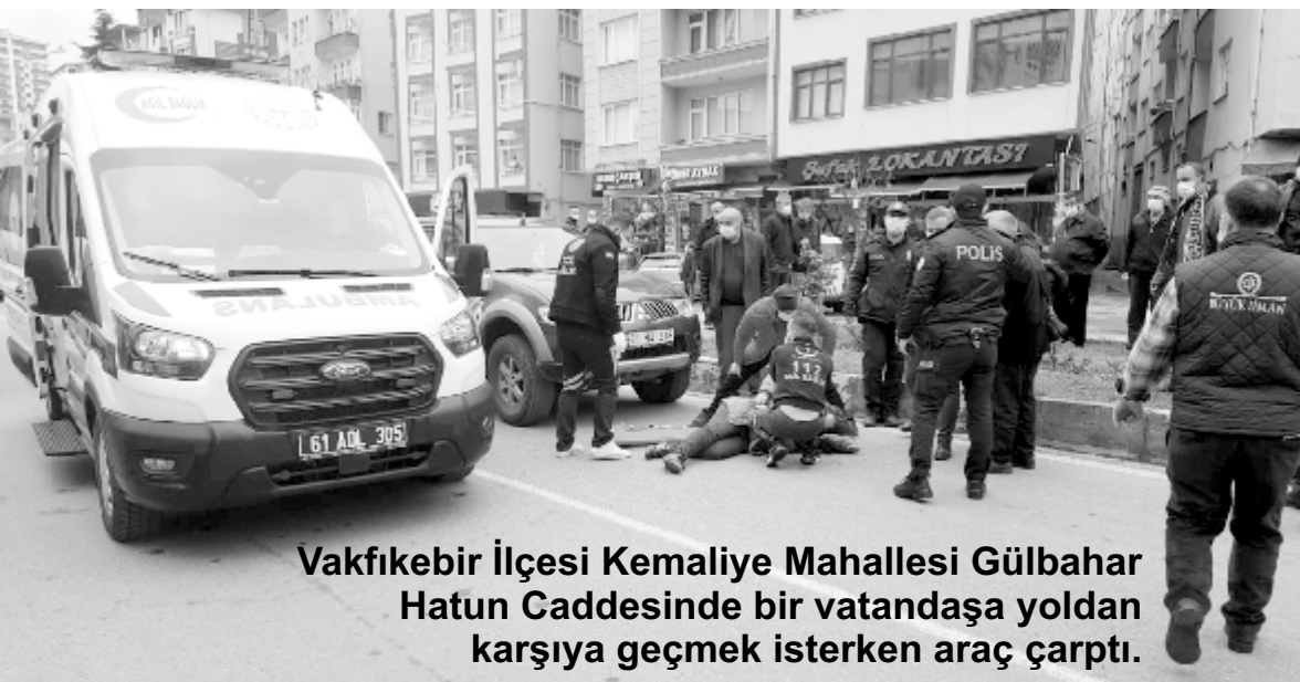
Vakfıkebir İlçesi Kemalîye Mahallesi Gülbahar Hatun Caddesinde bir vatandaşa yoldan karşıya geçmek isterken araç çarptı.

Eldiğimiz bilgilere göre; Vakfıkebir İlçesi Kemalîye Mahallesi Gülbahar Hatun Caddesi üzerinde bulunan Büyük İman Aile Sağlığı Merkezi önünde bir bayan