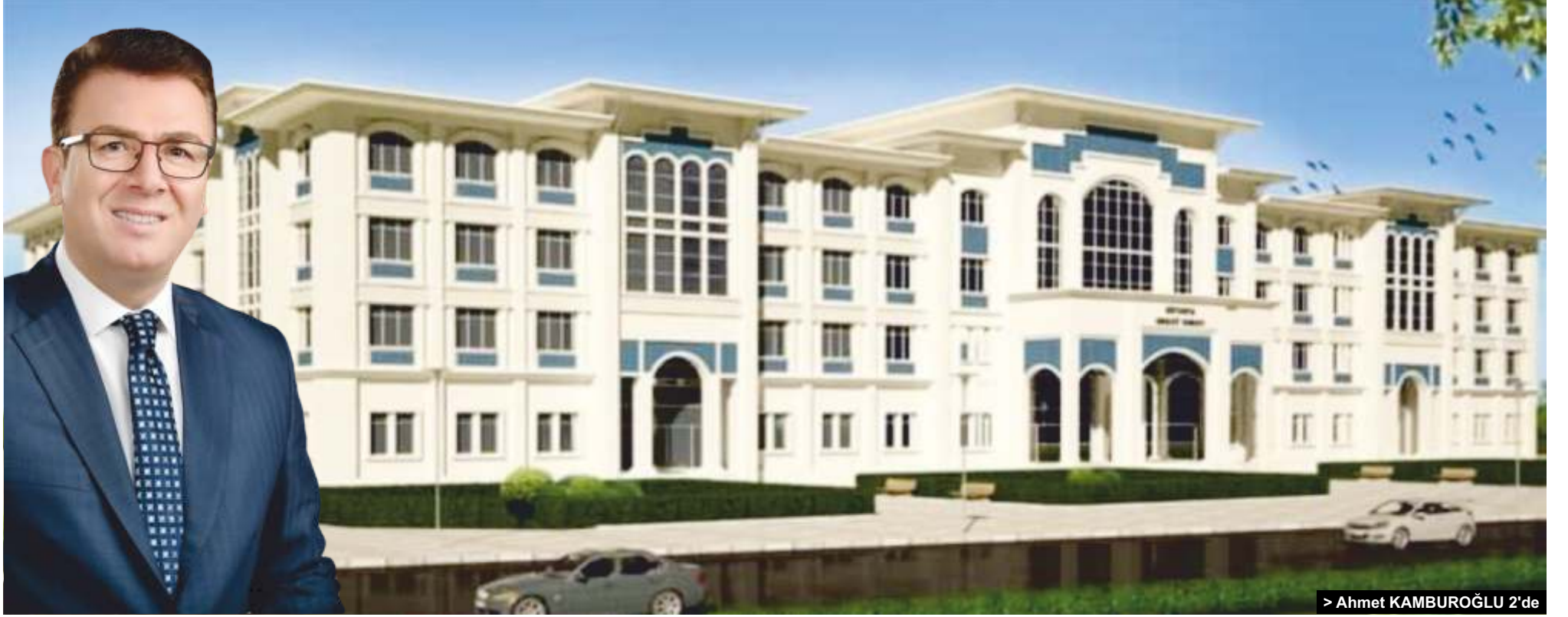
> Ahmet KAMBUROĞLU 2'de

4 ilçede yaklaşık olarak 76.500 nüfusa hizmet edecek olan Vakfikebir Adalet Sarayı Cumhuriyet Mahallesi'nde inşa edilecek. Vakfikebir Belediye Başkanı Muhammet Balta, "Cumhuriyet Mahallemizde 510 ada 1-2-3-4-5-6-7-8-9-10 nolu parselleri Belediyemiz İmar Planlarında Resmi Kurum (Adliye Sarayı) alanı yapılmak üzere belirlemiştik. Bahse konu parsellerin toplam tapu alanı 3.942,94 m 2 olup, 2.470,75 m 2 si belediyemiz tarafından satın alınmış ve Adalet Sarayı yapılmak üzere Adalet Bakanlığına tahsis edilmişti. Geriye kalan 1.472,19 m 2 si ise Adalet Bakanlığımız tarafından kamulaştırılmıştı. Kamulaştırma sonrası parseller tevhit edilerek, imar parseli haline getirilmişti. Şimdide Vakfikebirimizin ve yoremizin önemli bir ihtiyacına cevap verecek olan Vakfikebir Adalet Sarayımızın projelerinin hazırlanması ve zemin etüdü yapım işinin ihalesi gerçekleştirilecek.