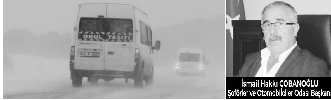
İsmail Hakkı ÇOBANOĞLU Şoförler ve Otomobilciler Odası Başkanı

Vakfikebir Şoförler ve Otomobilciler Esnaf Odası Başkanı İsmail Hakkı Çobanoğlu, 1 Aralık tarihinde başlayacak ticari araçlarda kış lastiği uygulaması konusunda sürücülere uyardı.